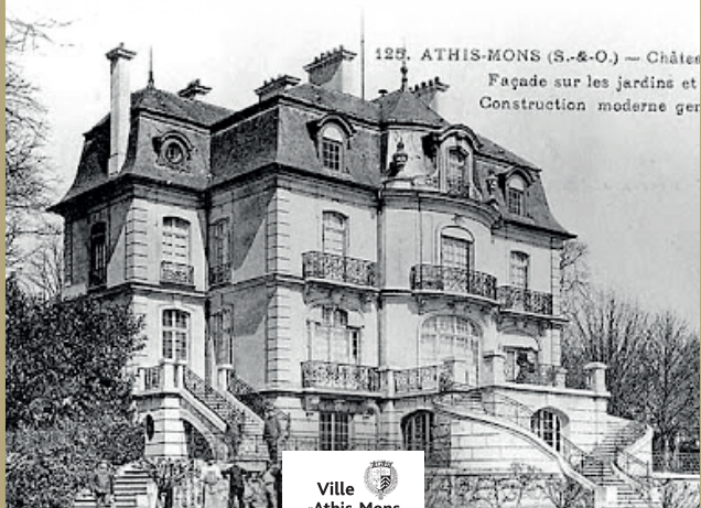
125. ATHIS-MONS (S.-&O.) — Châten Façade sur les jardins et Construction moderne ger