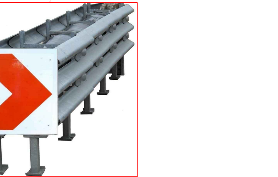
dispositif atténuateurs de choc

Phase n°2 : - Fermeture d'une voie en sens montant -Balisage en GBA béton