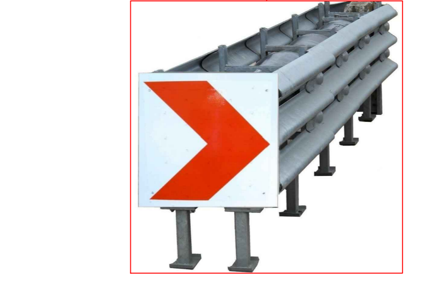
dispositif atténuateurs de choc