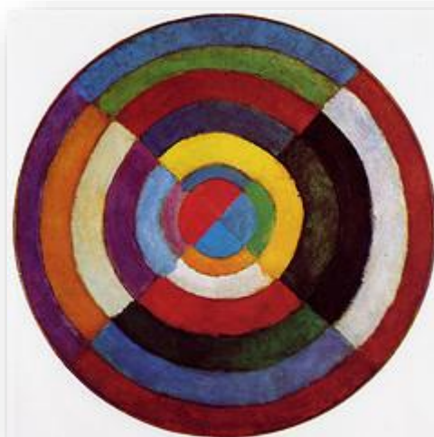
Disque simultané Robert Delaunay

Son nom est souvent lié à la Tour Eiffel dont il a vu la construction enfant et qu'il a peinte de nombreuses fois.